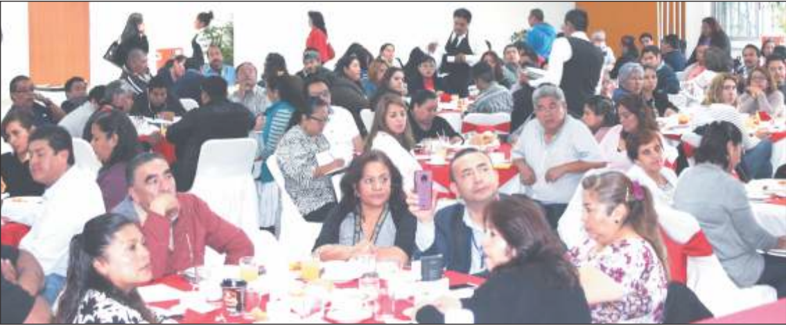
Asistentes al Taller de Calidad y Eficiencia.