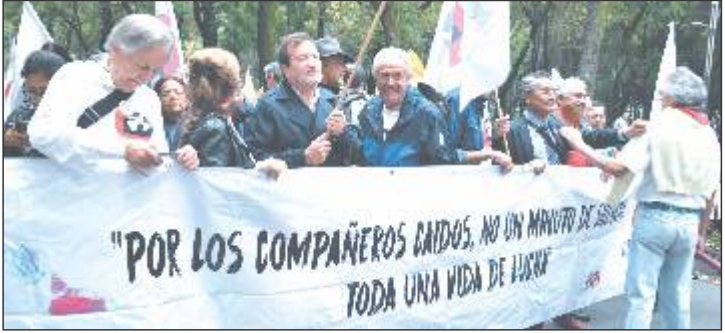
El Comité 68 formó parte de la vanguardia de esa movilización.