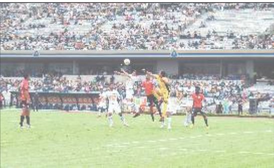
El equipo auriazul mostró personalidad y un juego ofensivo bien organizado.

Antes de iniciar el encuentro y justo cuando se entonaba el himno deportivo universitario, los jugadores mostraron una manta con la leyenda “Alto a la violencia” en reclamo a los acontecimientos que recientemente tuvieron lugar en la explanada de la Torre de Rectoría.