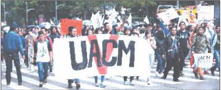
De nueva cuenta, los estudiantes de diversas casas de estudio marcharon como una sola comunidad.