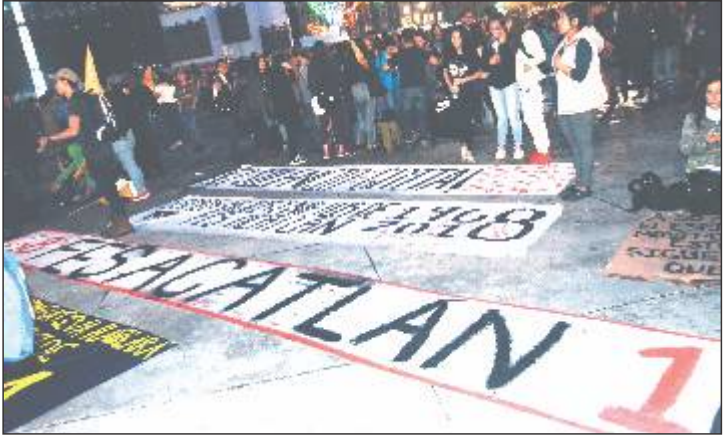
Al anochecer, los estudiantes llegaron por cientos al Zócalo capitalino.

Los integrantes de esta Comisión Mixta Central, parte STUNAM, dijeron que la normatividad del Programa de Calidad y Eficiencia en el Trabajo del personal administrativo, firmado en mayo de 2014, entre otros aspectos considera que el objetivo del programa de complemento al salario por calidad y eficiencia en el trabajo reconoce y estimula las capacidades y aplicaciones del personal para aumentar la calidad y eficiencia de los servicios que presta la institución con nueva actitud de cultura laboral, así como el mejoramiento de las percepciones económicas de los trabajadores.