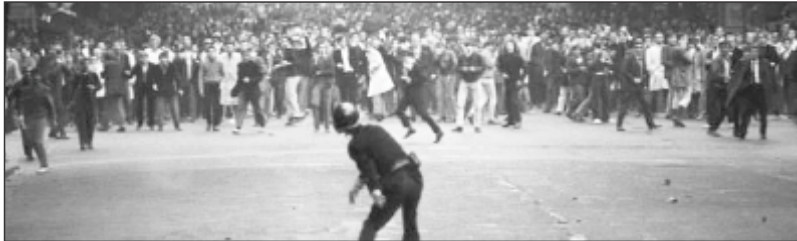
Mayo francés, 1968.

cultural galo, en entrevista expresó “No sé si todos saben que los eventos de la primavera del 68 comenzaron en realidad, el 9 de febrero del 68 justamente en la Cinemateca de París”, recuerda el director “Los cineastas franceses se levantaron contra el poder de la época que quería cambiar la dirección y tomar el control de esta institución independiente”.