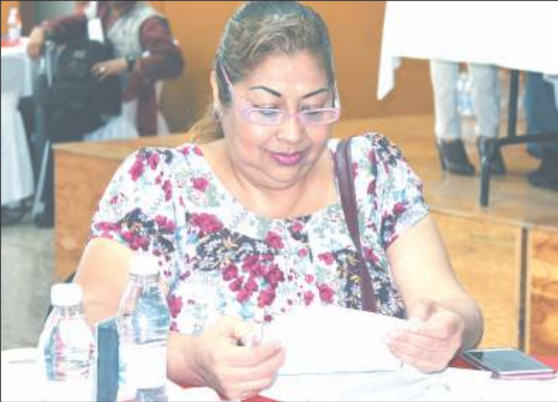
Compañeros Delegados y Subcomisionados de la Biblioteca Central, presentes en el Taller de Calidad y Eficiencia.