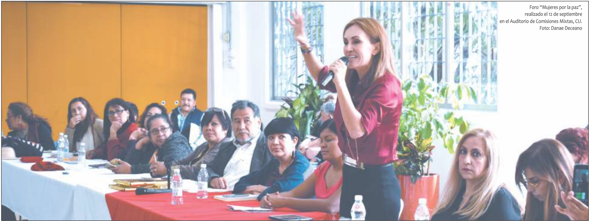
Foro “Mujeres por la paz”, realizado el 12 de septiembre en el Auditorio de Comisiones Mixtas, CU.

Viernes 21 de septiembre de 2018, año XLII, época VII, no. 1190 www.stunam.org.mx